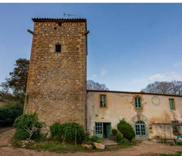
Carme Plana divulga els valors de la feina al camp i al bosc a l'aula d'entorn rural de Can Plana. Al mig, l'entrada de la masia i la torre de Can Vilar [a l'esquerra, l'exterior del mas, que es troba a Vallgorguina]. A baix, el pagès Jaume Cantalops. A la pàgina següent, el ramader Pere Serra amb un vedell a la finca de Can Thos.